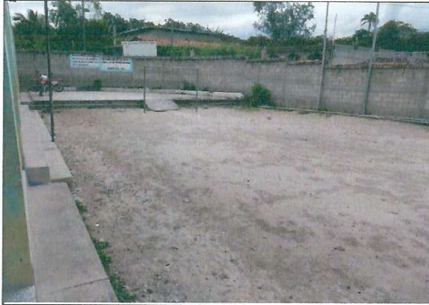
Foto1: Mejoramiento de Bases y Columnas de concreto.