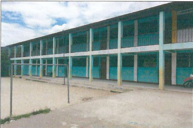
Foto 3: Mejoramiento del Cubierta de Lámina con Metal Galvanizado